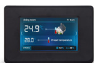
Panel pokojowy dotykowy Ester X80 bezprzewodowy