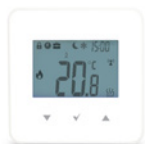
Panel pokojowy Ester X40 bezprzewodowy